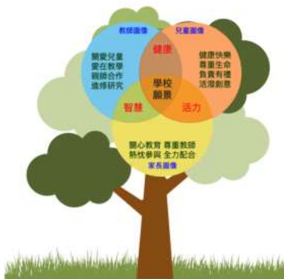
圖 1 學校願景與圖像統整圖